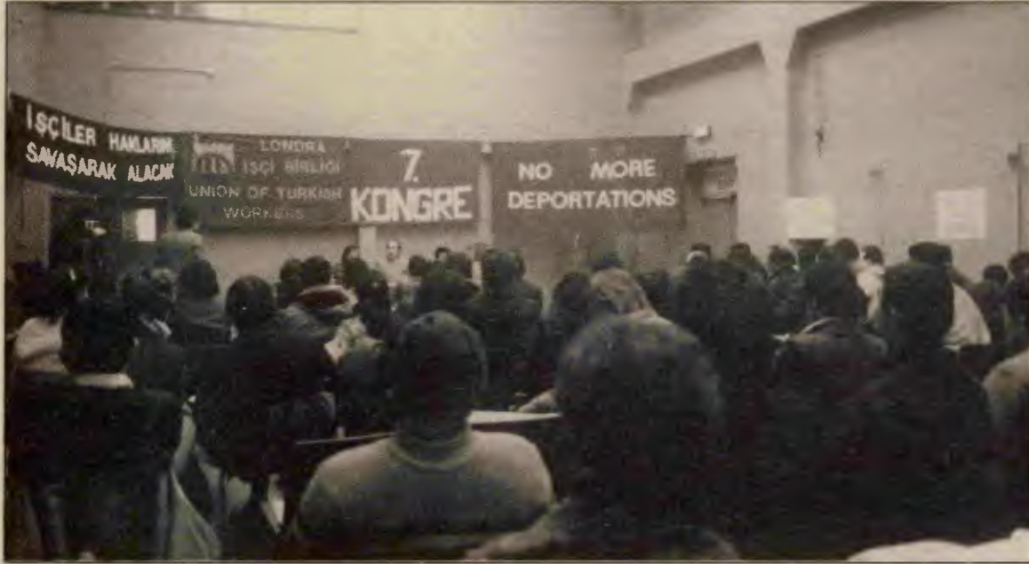
LİB 7. Kongresi başarılı ve yığınsal bir kongre oldu.