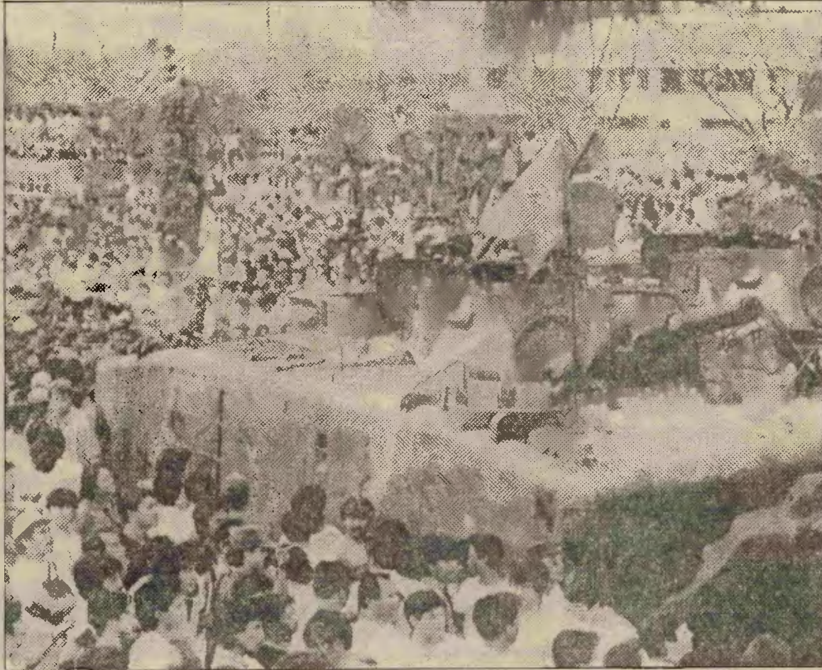
Filipinler'de herşeyi halkın aktif ve yığınsal protestoları belirledi.

Saat 10'da Marcos'un askerleri yeni bir saldırıya geçtiler, ancak halkla karşılaşınca saldırı sonuçsuz kaldı. Yarım saat sonra, Enrile ve Ramos geçici hükümeti kurduklarını açıkladılar. Öğle saatlerinde Marcos olağanüstü hal ilan etti. Televizyonda duyurusu bitmeden Enrile'ye bağlı askerler televizyon istasyonunu ele geçirdi.